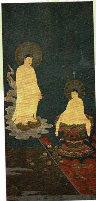
重要文化財 二河白道図(部分) 島根・萬福寺蔵(前期展示)