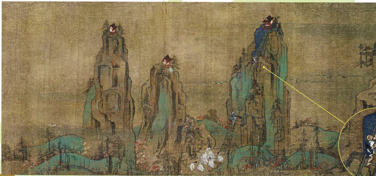
国宝 一遍聖絵 円伊筆 神奈川県 清浄光寺(遊行寺蔵)

巻2 奇石がそびえる伊予国(愛媛県)で修行! やまと絵と漢画が融合した中世日本の壮大な風景 (この場面は前期展示)