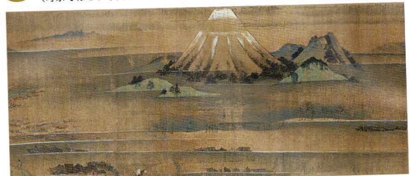
巻6 富士山が描かれた場面 見れば見るほど絵の中に引き込まれる (この場面は後期展示)