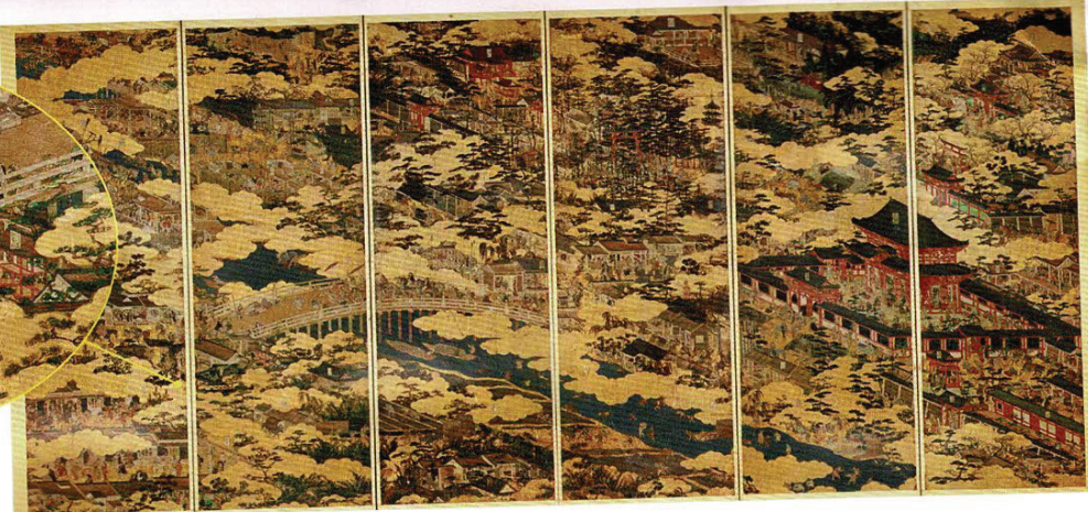
時宗寺院のひとつ、御影堂新善光寺が描かれた部分

国宝 洛中洛外図屏風(舟木本) 岩佐又兵衛筆 東京国立博物館蔵 (5月28日～6月9日展示)