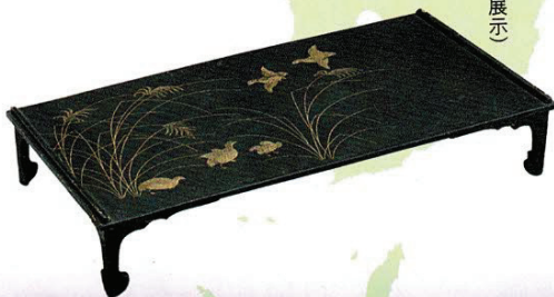
重要美術品 薄鷄時絵文台 京都・金蓮寺蔵(通期展示)

本像は通常お寺でも拝観することができない秘仏ですが、今回特別に公開されます。事前の調査で鎌倉時代のすぐれた像であることが確認され、中から納人品も見つかりました。