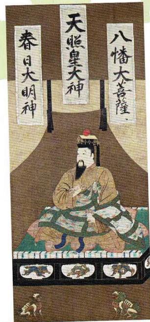
重要文化財 後醍醐天皇像 神奈川・清浄光寺(遊行寺)蔵(前期展示)