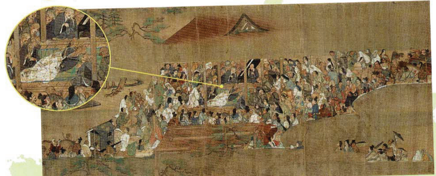
巻12 一遍臨終の場面 名もなき人びとの営みとともにあった一遍 (この場面は後期展示)