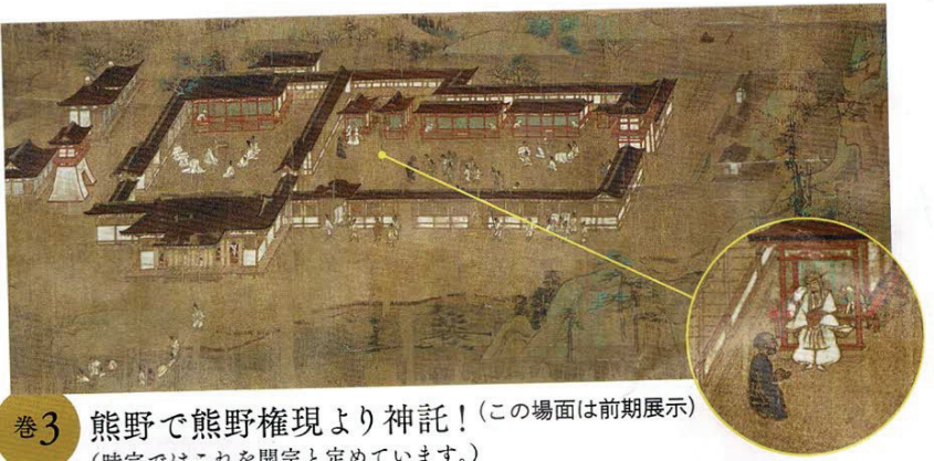
巻3 熊野で熊野権現より神託! (この場面は前期展示) (時宗ではこれを開宗と定めています。)