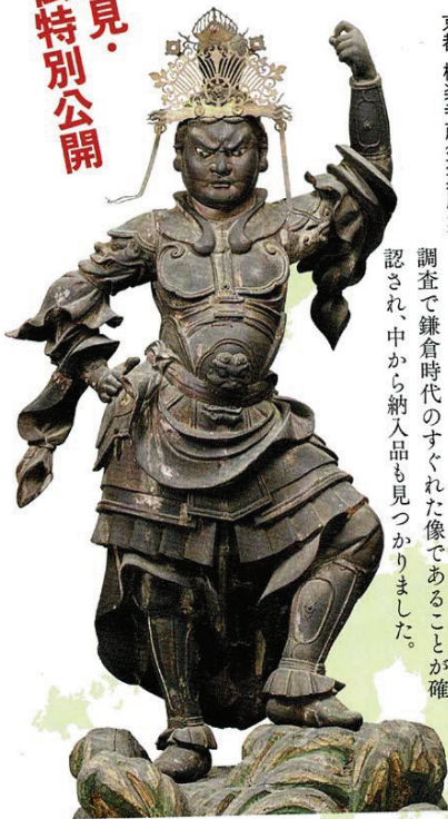
毘沙門天立像 京都・極楽寺蔵(通期展示)

本像は通常お寺でも拝観することができない秘仏ですが、今回特別に公開されます。事前の調査で鎌倉時代のすぐれた像であることが確認され、中から納人品も見つかりました。