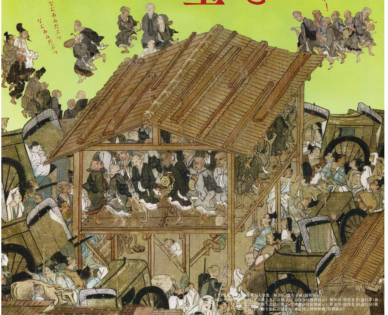
(上) 二祖上人坐像 神奈川・聖台寺蔵(通期展示) (中) 聖絵(踊り念仏の様子) この部分は後期展示 神奈川・清浄光寺(遊行寺)蔵 (下) 聖絵(踊り念仏の様子) この部分は前期展示 神奈川・清浄光寺(遊行寺)蔵 ※(右) 踊り念仏の様子 京都国立博物館蔵(前期展示)

Priest Shinkyō 700th Memorial Special Exhibition ART OF THE JI SHU