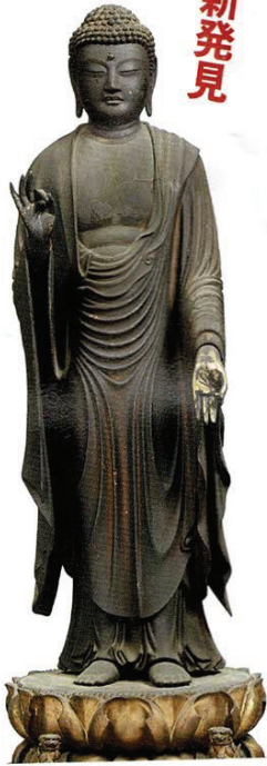
阿弥陀如来立像 行快作 京都・聞名寺蔵(通期展示)

展示会に先立つ調査で快慶の一番弟子行快の作であることがわかりました。行快の確実な作例はきわめて少なく、貴重な発見です。